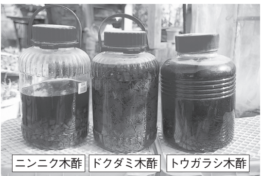
ニンニク木酢 ドクダミ木酢 トウガラシ木酢

木酢+aで効き目もパワーアップ。ニンニクは病気 に、ドクダミ・トウガラシは害虫に効く。(第4巻より)