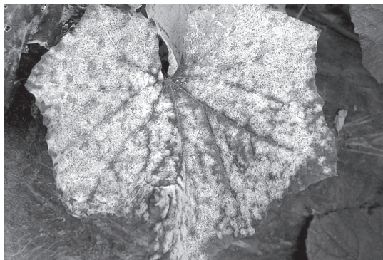
キュウリの葉に発生したうどんこ病 (第2巻より)