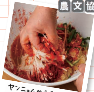
ヤンニョムから手づくり! 本場キムチ