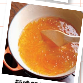
短時間加熱で キラキラジャム