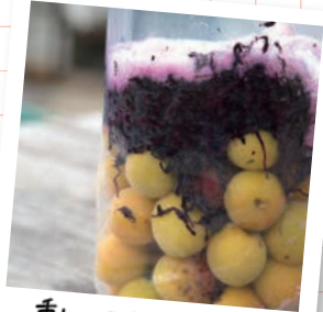
重しいらずでうかつくめ 袋漬け梅干し