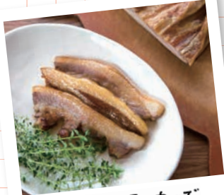
段ボールスモーカーで 本格ベーコン