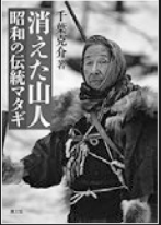
消えた山人 昭和の伝統マタギ

クマ狩り、皮はぎの神事熊祭り、小屋かけ、火起こし、装束や猟具など、37枚の貴重な写真から、初めて明らかになる秋田白宅(ももやけ)、玉川(伝統マタギの全貌)