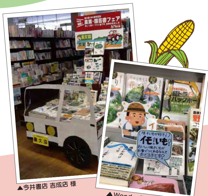
▲今井書店 吉成店 様

ご応募いただいた写真は、 弊社公式 twitter と Instagram で フェア期間中に発信し、集客アップにつなげます!